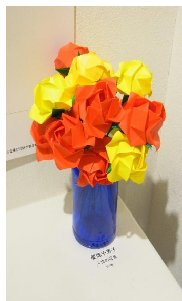
廣越千恵子 人生の花束 中嶋