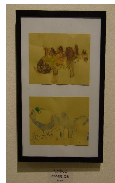
たがさんじ びくろの友近 田嶋 大正製薬